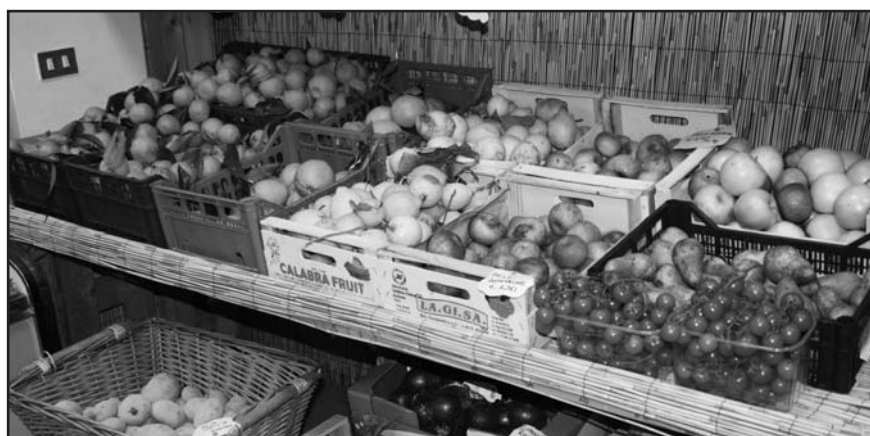
VERDURE DI STAGIONE: FRIARIELLI ED ALTRE SPECIALITÀ CAMPANE