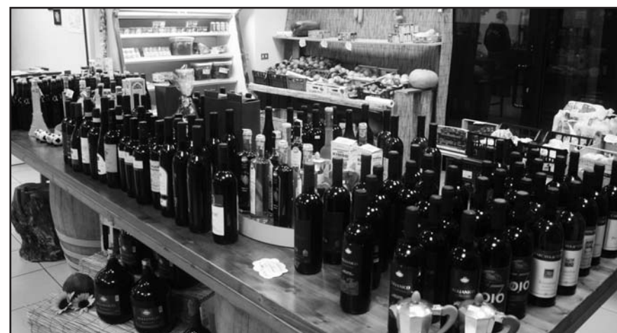
VASTO ASSORTIMENTO DI VINI CAMPANI

MONTICHIARI - VIALE EUROPA - TEL. 030.9650652 - CELL. 339.3054241