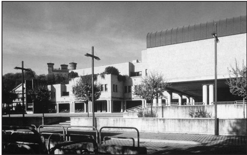
Il nuovo palazzo municipale di Montichiari, costruito nei primi anni '90 (1991-1995) sull'area del vecchio mercato del bestiame. L'opera costò al tempo quasi undici miliardi di lire e fu inaugurata il 12 maggio 1996.

pevate però che poi si arrabbia e perde il lume naturale. Avete messo il dito nella piaga, la piaga del Bilancio comunale che scricchiola a vista.