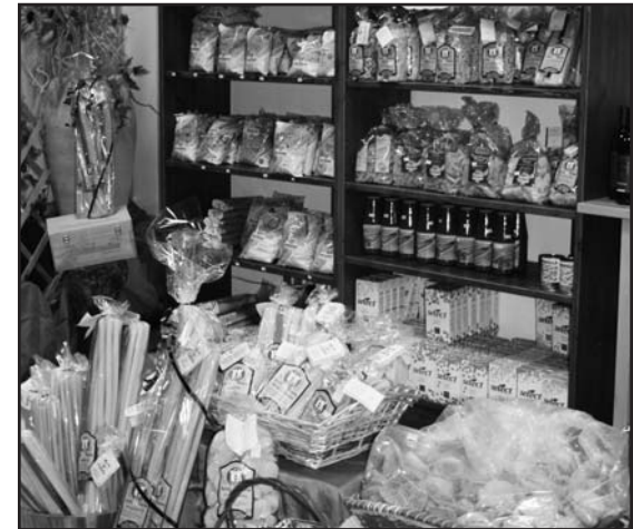
PANE, PASTA E DOLCI TIPICI NAPOLETANI