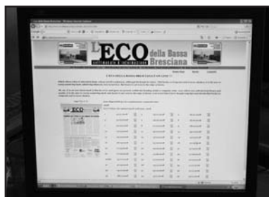
www.ecodellabassa.it: le edizioni del 2008.

Però è certo che la verità non viene fuori da una voce a senso unico, nemmeno se è la voce della presunta maggioranza. Anche la voce più sola ha il diritto-dovere di esprimersi, un dovere che ri-