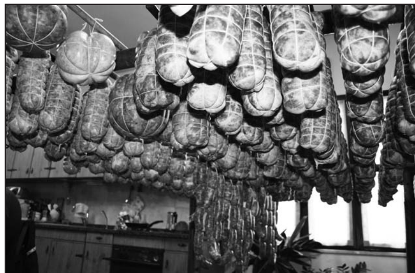
I salami appesi alla classica pertica.