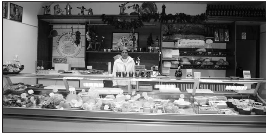
BANCO DI PRODOTTI FRESCHI - NUOVI ARRIVI MARTEDÌ E VENERDÌ - SI ACCETTANO PRENOTAZIONI