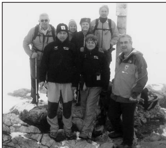
Alcuni partecipanti all'escursione.

Non meno attivo il "Gruppo" nella veste socio-culturale. Molto