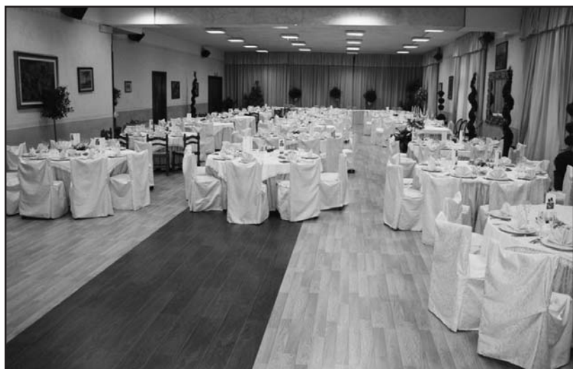
Al Green Park Boschetti una serata particolare per la festa dell'Eco.

stello" vuole pubblicamente ringraziare tutta la redazione, i collaboratori che gratuitamente si impegnano per poter far arrivare in redazione articoli, notizie, considerazioni per poter arricchire sempre di più la comunicazione con voi lettori.